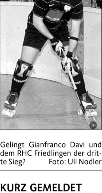
Gelingt Gianfranco Davi und dem RHC Friedlingen der dritte Sieg?

Nach der Niederlage in der ersten Partie gegen den RHC Uri (5:8) gingen die Friedlinger in den letzten beiden Spielen gegen den RSC Uttigen (10:1) und gegen Biasca (9:8) als Sieger vom Platz.